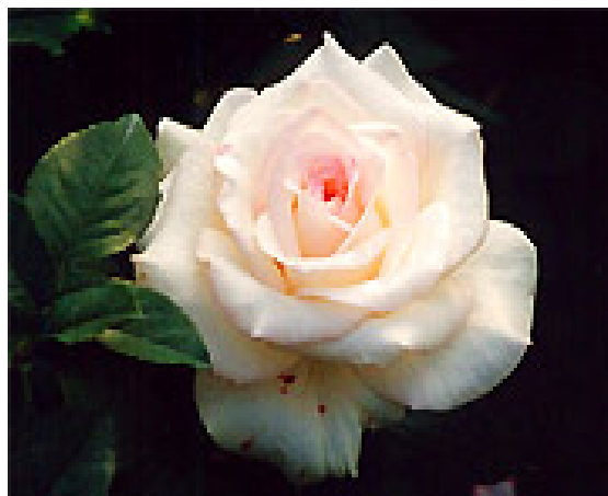
図2 ばら (初恋)